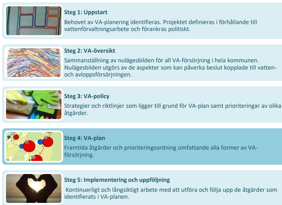
Figur 1: VA-planeringens fem steg.

Varbergs strategiska VA-planering baseras på de fem steg som rekommenderas i Havs- och vattenmyndighetens Vägledning för kommunal VA-planering 4 , se Figur 1. Vägledningen tydliggör VA-planeringens roll utifrån vattendirektivet och åtgärdsprogrammet för Västerhavet. Varbergs VA-plan omfattar dricks-, spill- och dagvatten både inom och utanför verksamhetsområdet för allmänt VA.