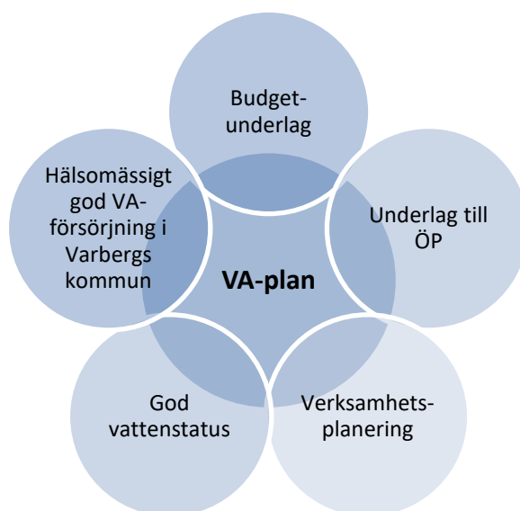
Figur 2. Strategisk VA-planering i Varbergs kommun har många olika nyttor, kopplade till miljön, till kommunens verksamhet och till invånarna.

För de delar i kommunens organisation som ansvarar för VA-planens åtgärder blir planen dessutom ett underlag för fortsatt verksamhetsplanering och budgetarbete. Åtgärder tydliggörs och tidsätts i VA-planen för att underlätta både den kortsiktiga och långsiktiga planeringen.