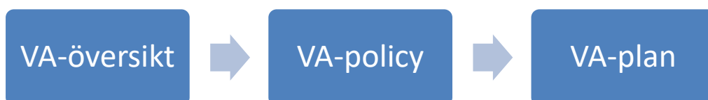
Figur 3. VA-planeringens tre huvuddokument.

Denna VA-plan är det tredje dokumentet som ingår i kommunens övergripande VA-planering 6 . De två tidigare dokumenten är VA-översikt och VA-policy , se Figur 3.