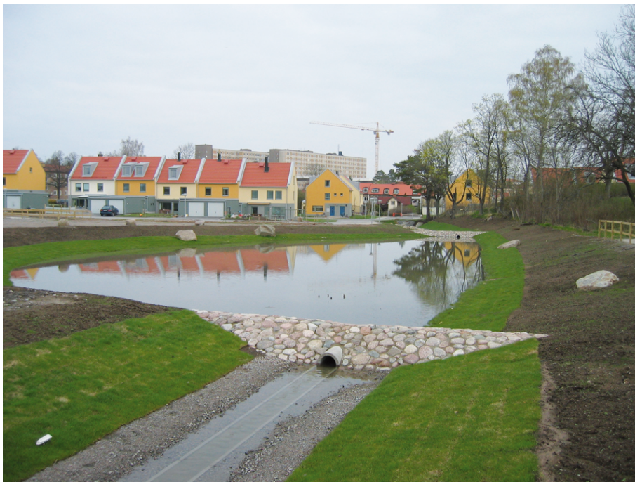
Figur 3. Dagvattenstråk Tinnerbäcksgård

Fastighetsägarens ansvar regleras bland annat i lagen om allmänna vattentjänster och kommunens allmänna VA-bestämmelser (ABVA).