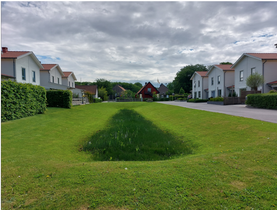
Figur 2. Dagvattenåtgärd (svackdike) i villaområde.

Att ta hand om dagvatten på ett hållbart sätt är viktigt för att minska risken för översvämningar och begränsa spridningen av föroreningar till sjöar och vattendrag. Dagvatten bör ses som en resurs och tas omhand så nära källan som möjligt.