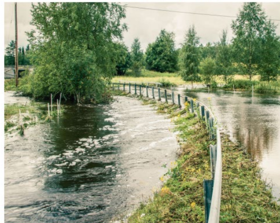
Havs- och vattenmyndighetens rapport 2015:15

En översiktlig genomgång av juridiken kring dricksvattenförsörjning samt avledning och rening av spillvatten och dagvatten