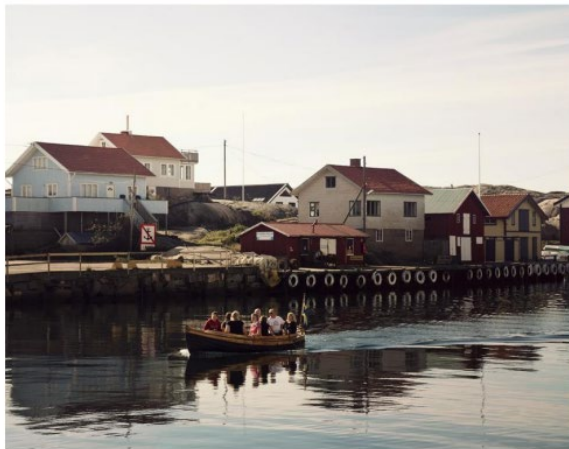
Havs- och vattenmyndighetens rapport 2014:1

för hållbar VA-försörjning och god vattenstatus